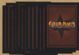
35 kártyából álló kazamatapakli